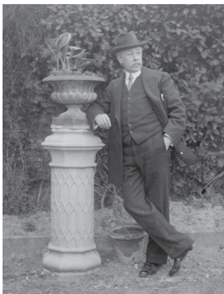
AUTORRETRATO / AUTORETRATU (ARCHIVO GENERAL DE NAVARRA / NAFARROAKO ARTXIBO OROKORRA)

Argazkilari ez-profesionala. Militarra, historialaria ( Sarasateren memoriak, Nafarroako artearen historiarako datuak ), geografoa ( Nafarroako Erresumaren geografia orokorra, Nafarroako geografia historikoa ) eta enpresaria. Nafarroako Monumentu Historiko eta Artistikoen Batzordeko kide gisa, Nafarroako artea argazkigintzan dokumentatu zuen. Bere beste helburu fotografikoa bere familia izan zen, bere bizitza osoan zehar erretratatu zuena.