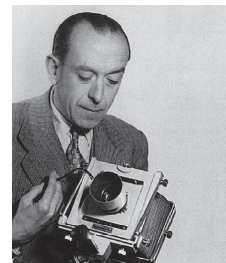
AUTORRETRATO / AUTORRETRATU