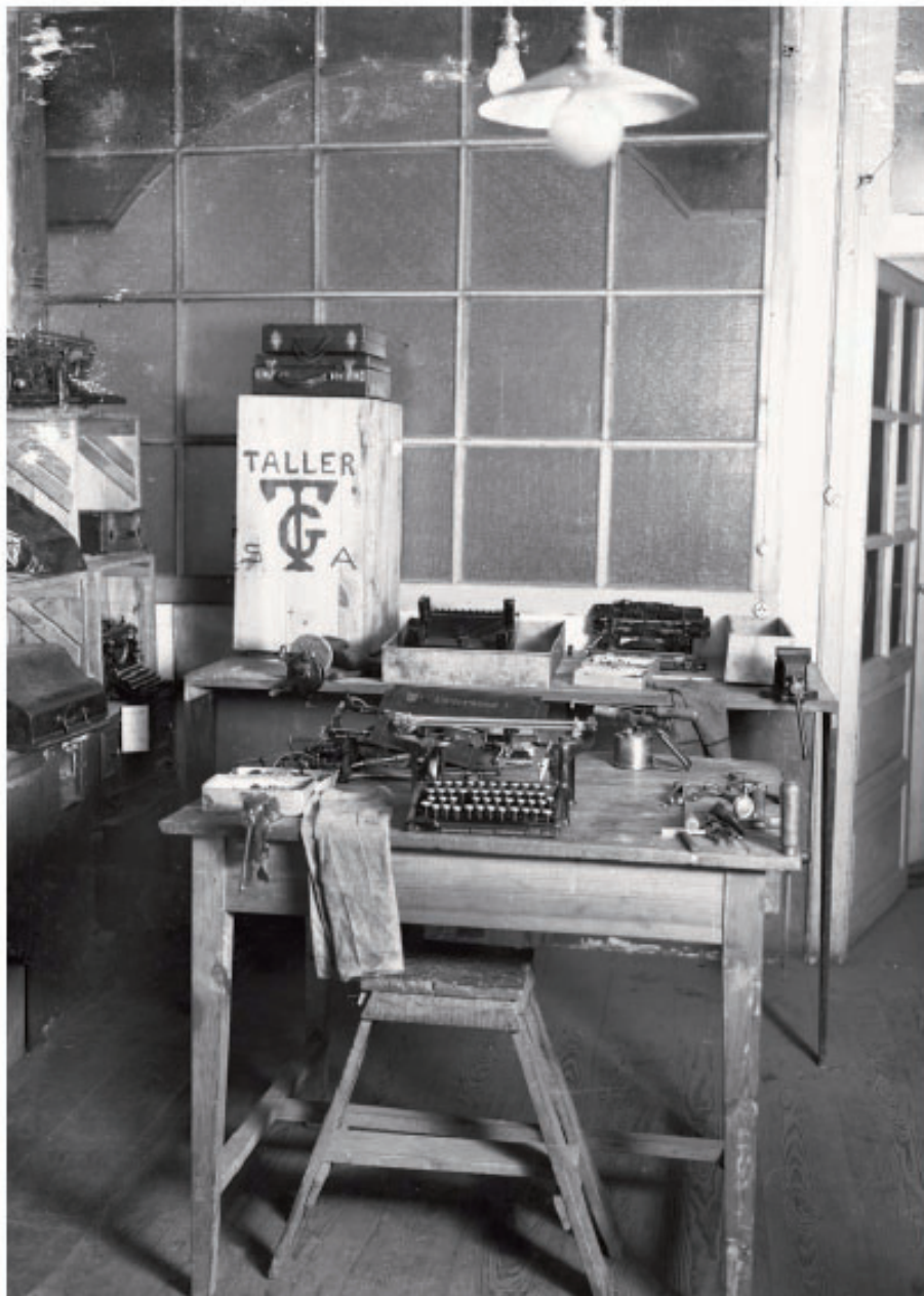
El taller Guillermo Trúniger S. A. tailerra