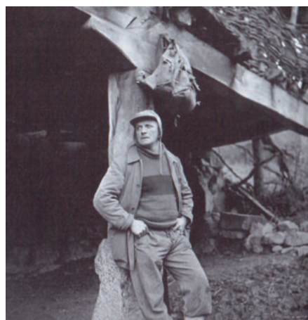
AUTORRETRATO / AUTORETRATU (MUSEO DE NAVARRA / NAFARROAKO MUSEOA)