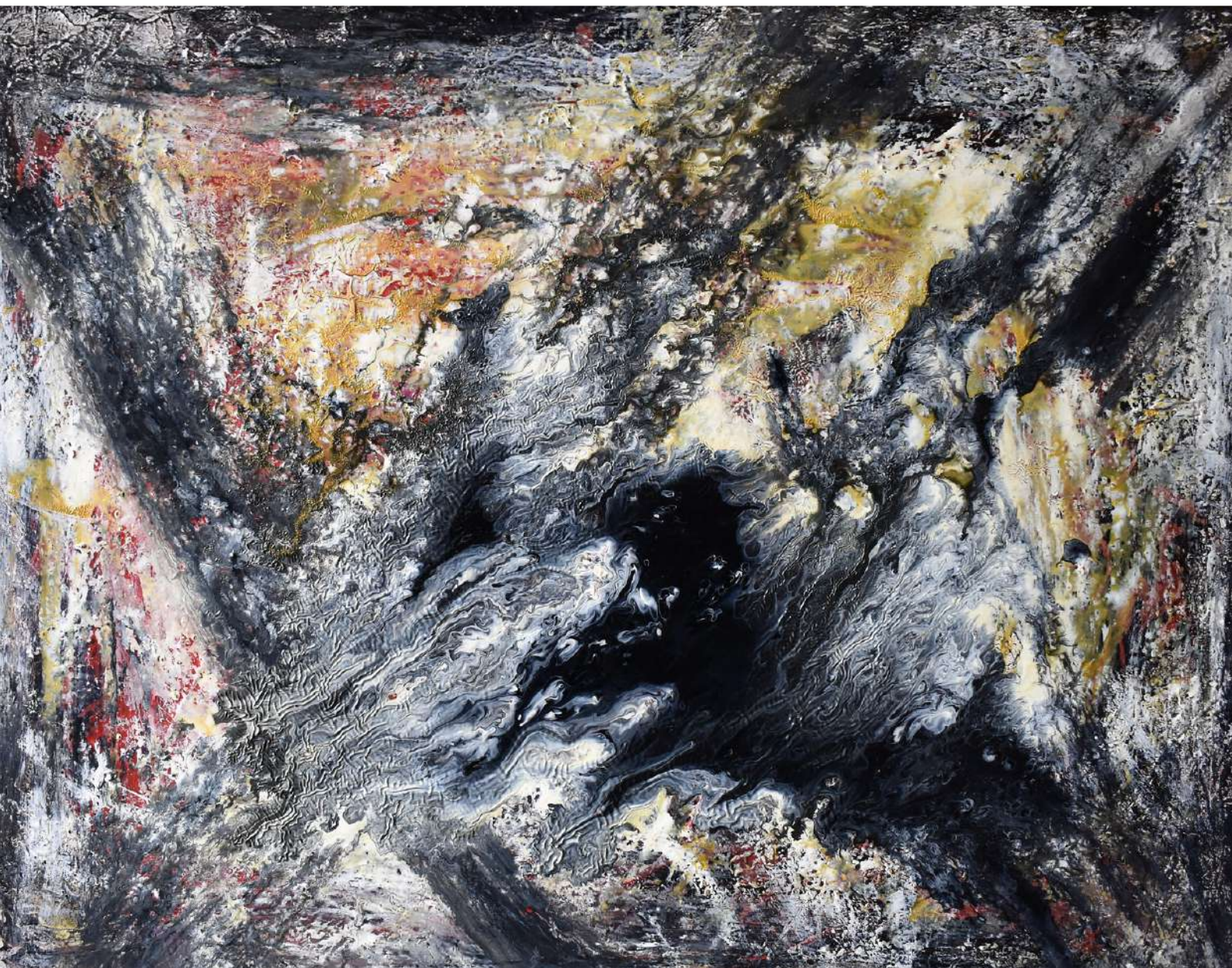
Huida. Técnica mixta sobre tabla. 57 x 72 cm. 2020.