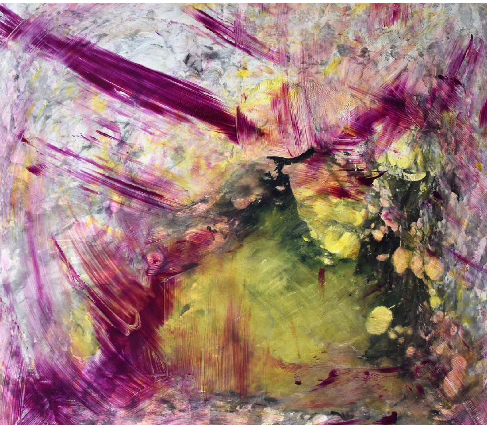
Vida. Técnica mixta sobre tabla. 68,5 x 77,5 cm. 2020.