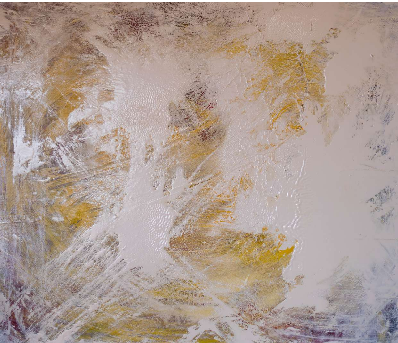
La victoria del blanco. Técnica mixta sobre tabla. 71 x 81,5 cm. 2020.