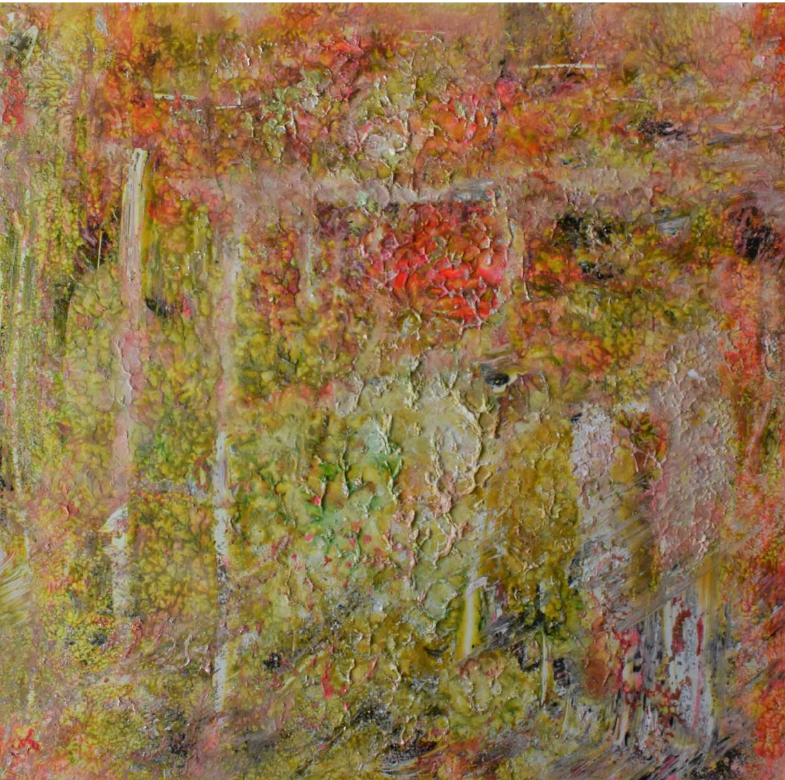
Belleza del Instante II. Técnica mixta sobre tabla. 60 x 60,5 cm. 2020.