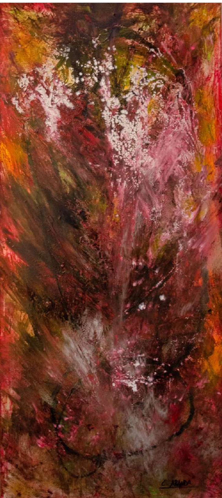
Plenitud. Técnica mixta sobre tabla (Izquierda) 121,5 x 54 cm.