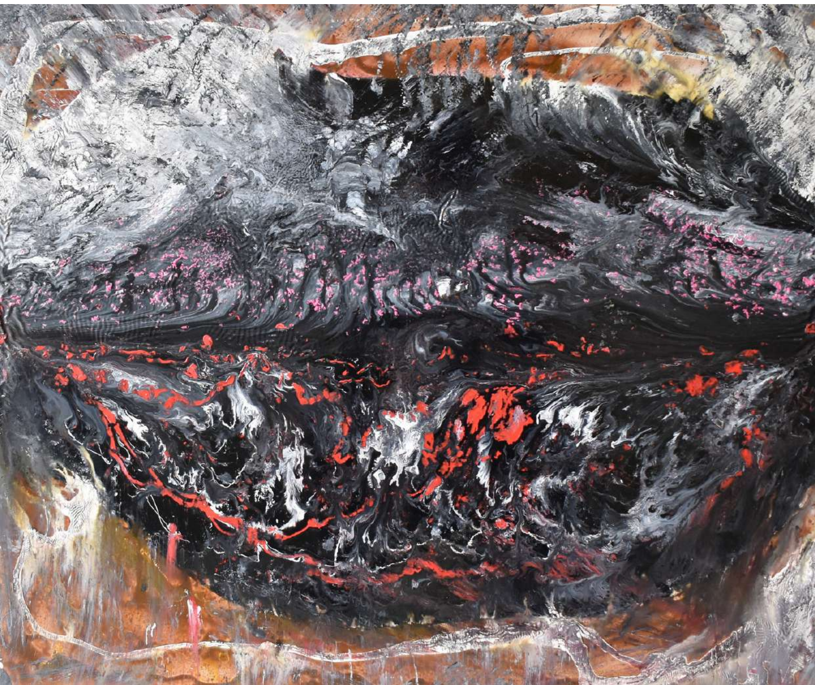
Vacío que todo lo llena Técnica mixta sobre tabla. 63,5 x 73,5 cm. 2020.