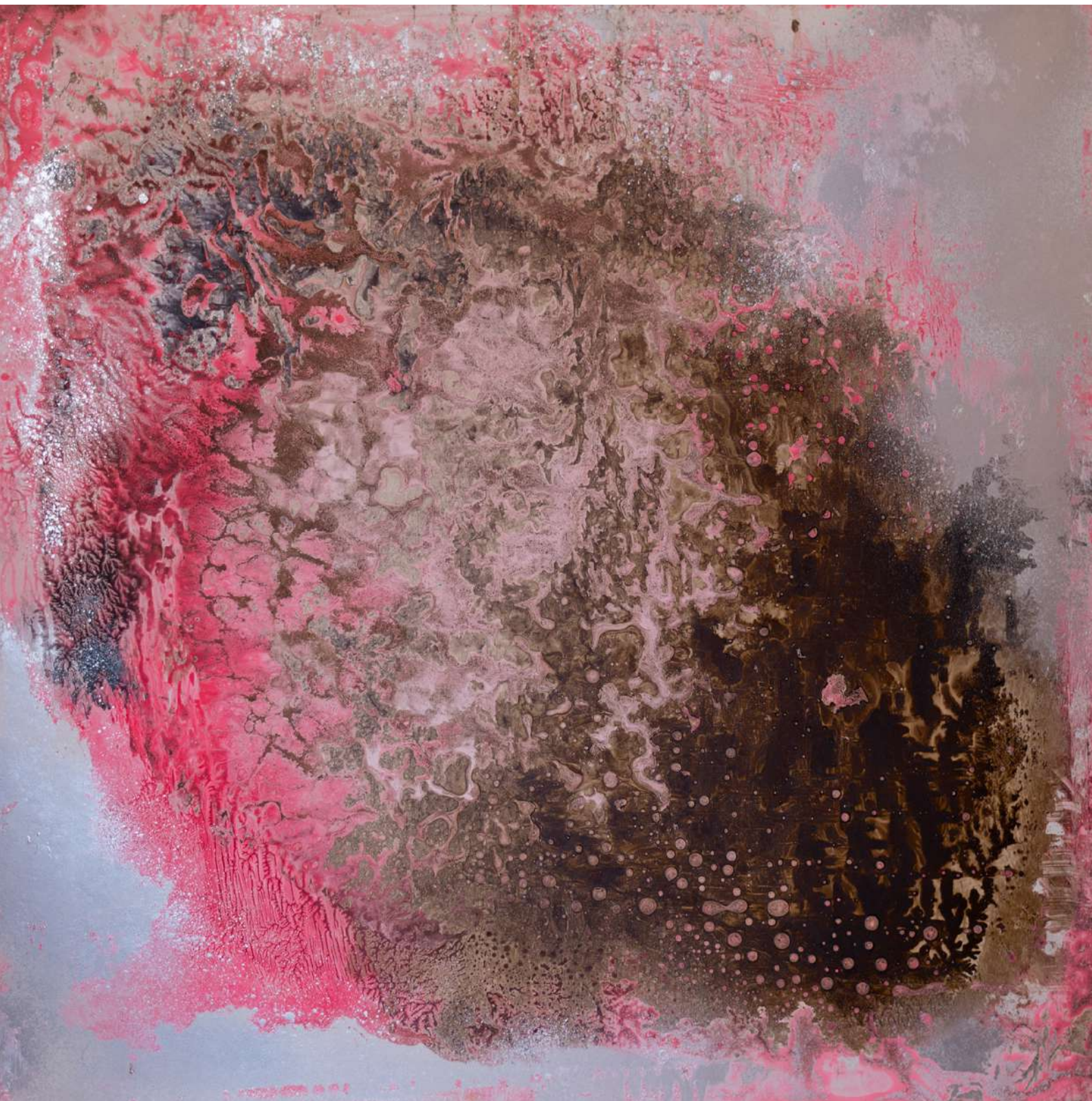
Fondo Marino I. Técnica mixta sobre tabla. 60 x 60,5 cm. 2020.