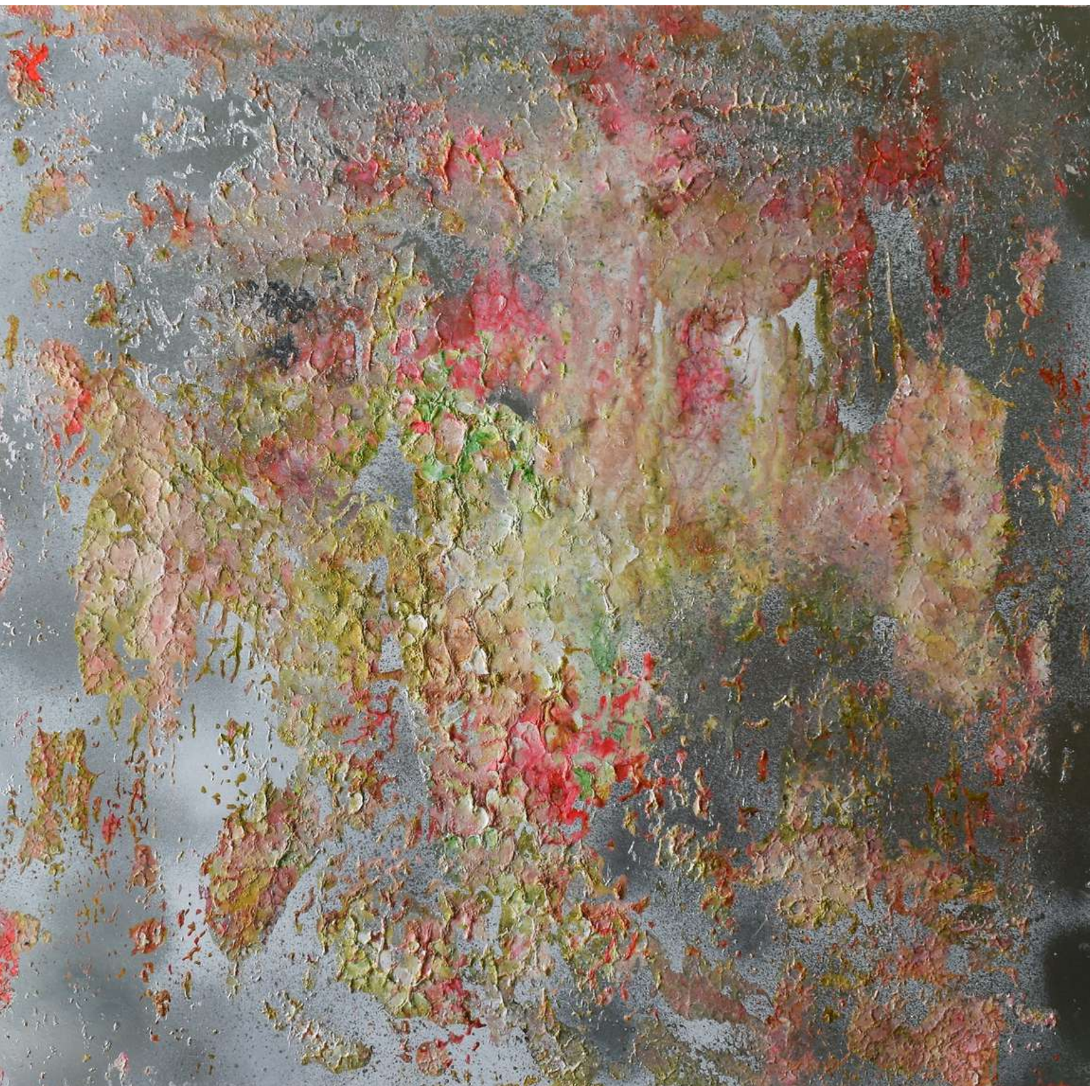
Belleza del instante I. Técnica mixta sobre tabla. 60 x 60 cm. 2020.