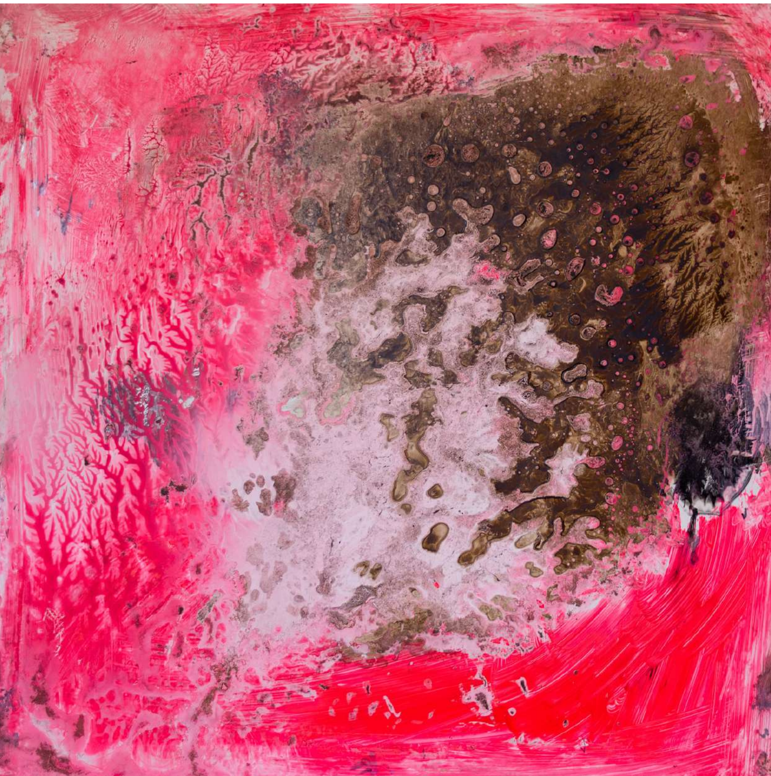
Fondo Marino II. Técnica mixta sobre tabla. 60 x 60,5 cm. 2020.