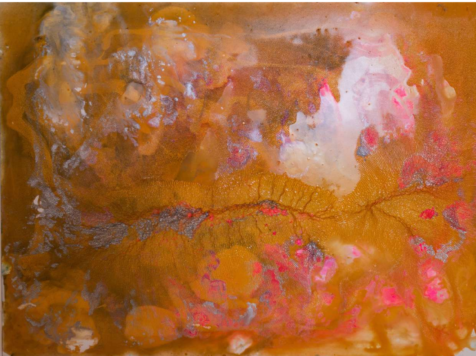
Armonía. Técnica mixta sobre tabla. 61,5 x 81 cm. 2020.