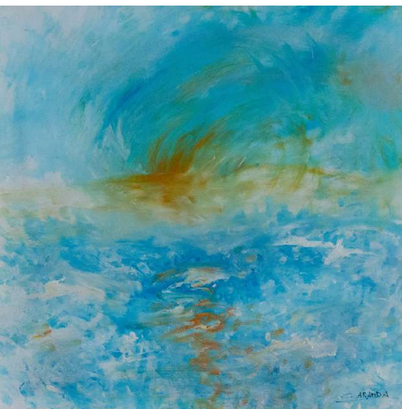
Azul y agua. Técnica mixta sobre tabla. 57 x 61 cm.